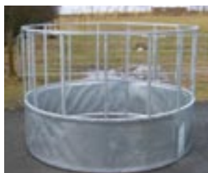
Gjafagrind fyrir stórgripi