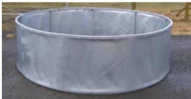
Gjafagrind fyrir hesta

VIG létthlið er hagkvæm og góð lausn en hliðunum er hægt að raða saman að vild. Létthliðin eru seld í einingum þannig að það er hægt að raða saman hliði sem hentar mismunandi aðstæðum, hvort heldur á að girða af sumarhús eða tún.