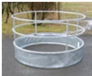
Gjafagrind fyrir sauðfé

VIG hefur framleitt gjafagrindur allt frá stofnun fyrirtækisins en tók sér nokkurt hlé um stund enda viljum við aðeins bjóða íslenskum bændum góða vöru á samkeppnishæfu verði. Nú getur VIG uppfyllt þá sjálfsgöðu kröfu.